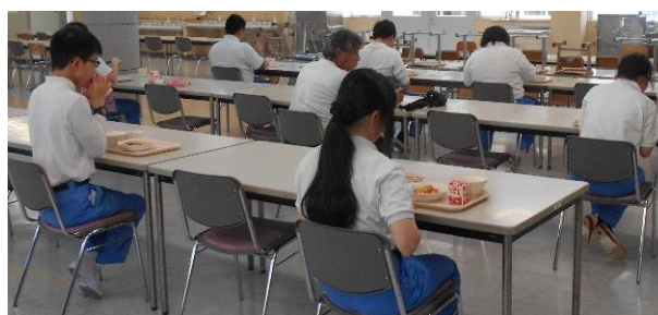
給食は隣との間隔をとり、一方向を向いて食べています。