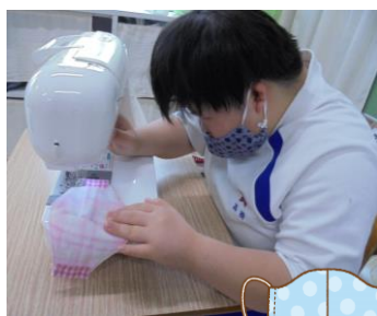
布マスクを作りました。