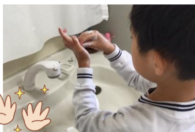
ていねいに手を洗っています！