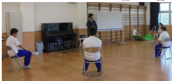
ソーシャルディスタンスについて学習し、授業や教室移動の際に実践しています。