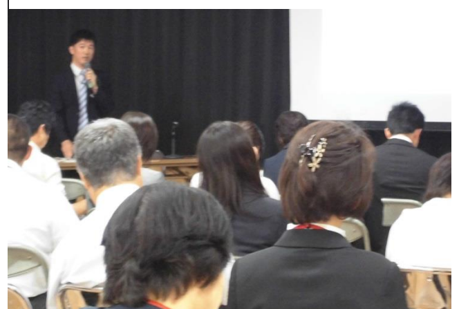
▲講義「課題発見解決学習を推進した授業づくり」