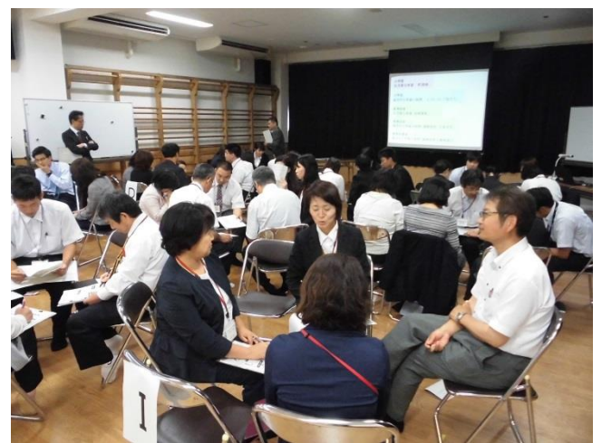
▲演習「課題発見解決学習（イメージ）を基にした授業づくり」グループ協議の様子