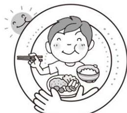
1日3食 バランスよい食事