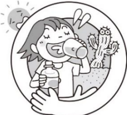
こまめな水分、塩分補給