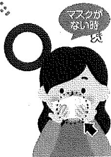
ティッシュ・ハンカチで 口・鼻を覆う