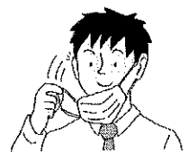
マスクのひもを 持って外します

マスクを外す時は、ゴムやひもをつまみはずし、手指にウイルス等が付かないよう、なるべくマスクの表面には触れず、内側を折りたたんで清潔なビニールや布等に置くなどして清潔に保ちます。