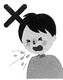
何もせずに 咳やくしゃみをする