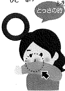
袖で口・鼻を覆う