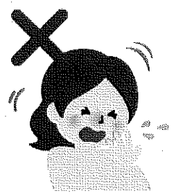
咳やくしゃみを 手でおさえる

マスクを外す時は、ゴムやひもをつまみはずし、手指にウイルス等が付かないよう、なるべくマスクの表面には触れず、内側を折りたたんで清潔なビニールや布等に置くなどして清潔に保ちます。