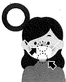
マスクを着用する (口・鼻を覆う)